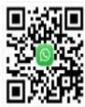
3 кезең тапсырма