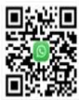
2 кезең тапсырма